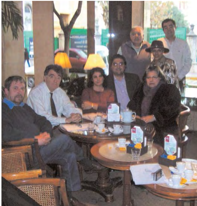
Nella foto alcuni dei componenti il Comitato per l'itinerario arabo-normanno di Cefalù, Palermo e Monreale, quale patrimonio dell'umanità, costituito a Cordoba

Nel corso della scorsa primavera in occasione di incontri ed altre iniziative promosse dall'Istituto Italiano Fernando Santi, sono state avviate attività preliminari finalizzate a costituire Comitati di sostegno al riconoscimento da parte dell'Unesco nelle città di Sanremo, Milano, Nizza, Mar del Plata e Buenos Aires.