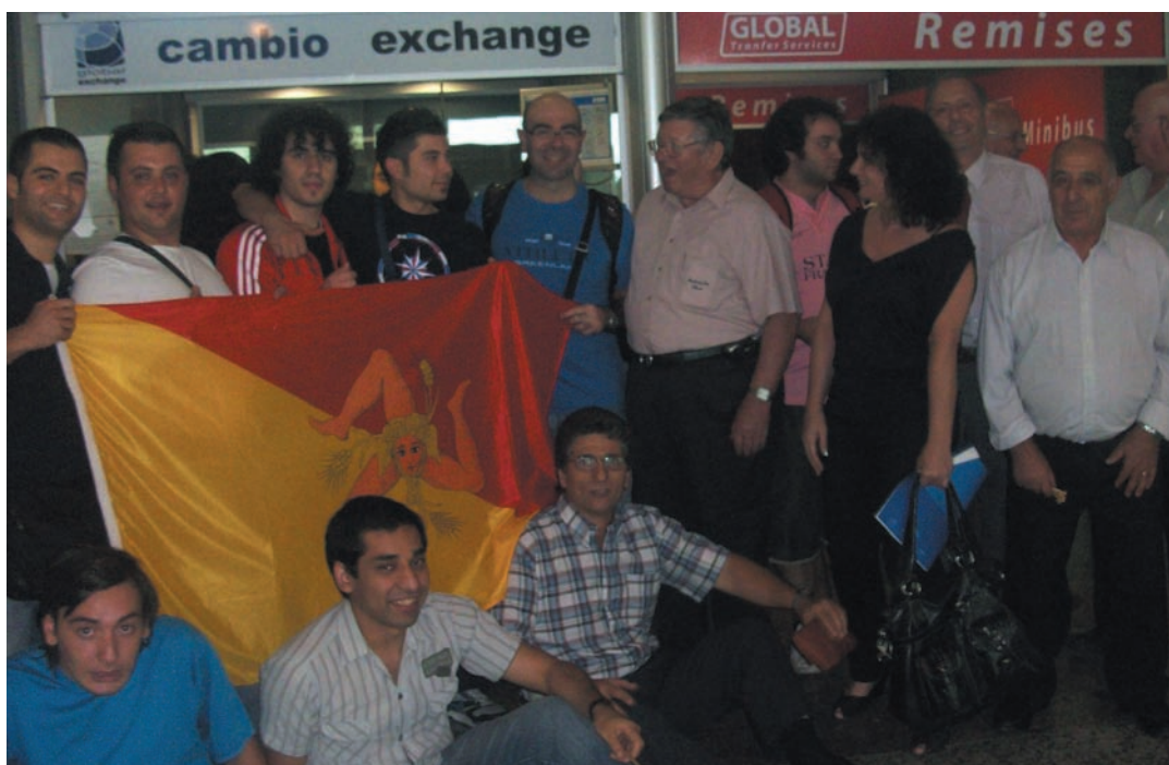
Il gruppo di giovani studenti delle Madonie all'arrivo all'aeroporto di Cordoba

Dopo aver preso possesso degli alloggi i giovani siciliani sono stati accompagnati presso la sede della Famiglia Siciliana di Cordoba dove hanno subito partecipato ad una festa in loro onore con degustazioni di prodotti tipici argentini.