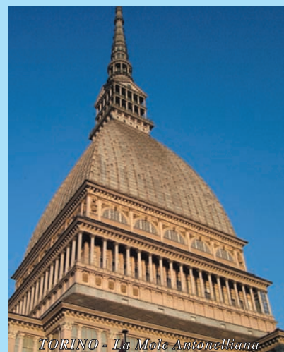
TORINO - La Mole Antonelliana