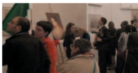
Accanto la mostra sull'Epopea di Garibaldi all'Ottagono Santa Caterina visitata da un vasto pubblico. Sotto la banda musicale V.M. Pintorno di Cefalù che ha eseguito alcuni emozionanti brani patriottici

Il convegno ha illustrato la figura di Giuseppe Garibaldi e la sua esperienza in America Latina, determinante per il