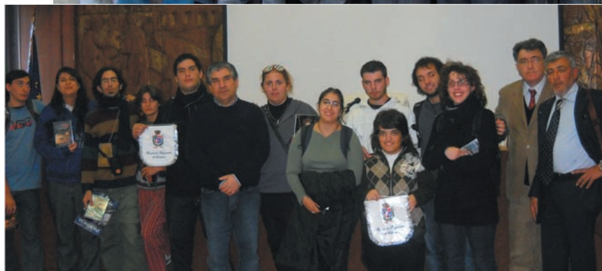
Il gruppo di studenti di Cordoba in due diverse occasioni della loro visita in Sicilia: in alto in Piazza Politeama, a Palermo. Nella foto accanto nei locali della Provincia di Catania