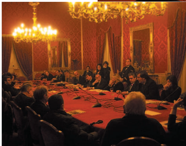
Nella foto accanto, il tavolo dei componenti il comitato di supporto alla candidatura dell'itinerario arabo-normanno di Palermo, Monreale e Cefalù a patrimonio dell'umanità.