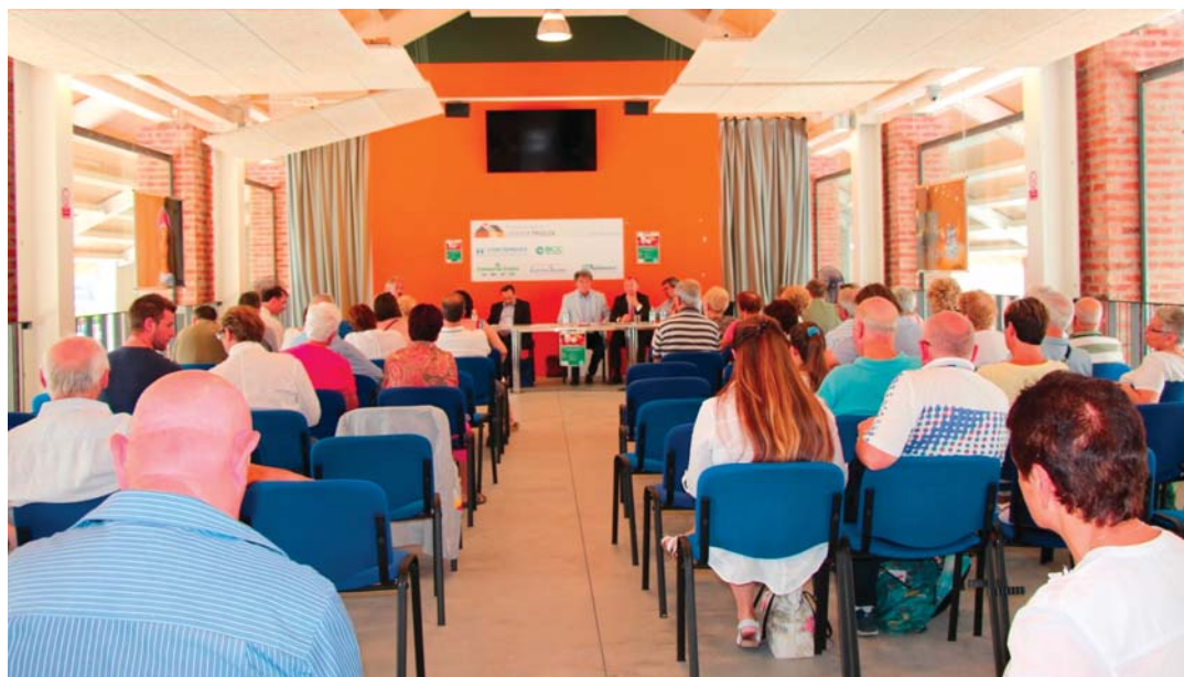
Nella foto sopra, la sala presso la Cascina Triulza dove il 10 luglio scorso si è svolta la manifestazione sul tema "Gli Italiani nel mondo: ambasciatori della sana alimentazione"