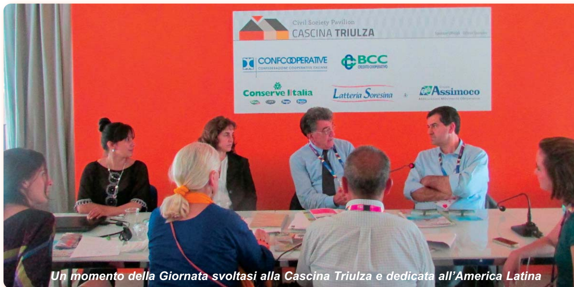
Un momento della Giornata svoltasi alla Cascina Triulza e dedicata all'America Latina

Una giornata interamente dedicata all'America Meridionale incentrata sui temi dell'alimentazione, dell'ambiente, del suolo e del sottosuolo con Venezuela, Bolivia, Ecuador, Perù, Argentina e Brasile in prima linea