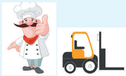
HOSTESS CONGRESSUALE - 1 posto -

HOSTESS CONGRESSUALE, INFORMATORE SCIENTIFICO, CAMERIERE, ECC.