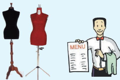
SENIOR ASSOCIATE CORPORATE - 1 posto -